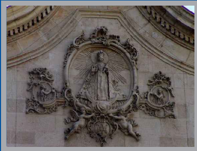
Relieve de la Virgen del Carmen. S. XVIII. Fachada de la Iglesia de Ntra. Sra. del Carmen de Murcia.

La fachada de la iglesia del Carmen de la ciudad de Murcia aparece coronada con un extraordinario relieve de su titular. Una moldura decorada con rocallas y sostenida por dos ángeles tenantes alberga la hechura de María sobre nube, ataviada con la indumentaria con la que los fieles la encuentran después en el camarín, anticipando ya en el exterior lo que se descubre dentro del templo. Con una vestimenta propia del siglo XVIII, bajo el manto, que simula un tejido brocado adornado con lazos y flores en el perfil, la Virgen viste la túnica carmelitana con el escapulario que cuelga desde la entallada cintura por debajo del corpiño. En la mano porta los escapularios y el cetro, como es propio de la orden del Carmen Calzado de la que fue su iglesia conventual hasta el siglo XIX. A ambos lados, dos medallones de menor tamaño contienen las efigies de dos almas del purgatorio que imploran el amparo de la Santísima Virgen. Este conjunto iconográfico pone de relieve el significado profundo del templo que abre sus puertas en esta bella fachada como lugar de encuentro de toda la Iglesia: el fiel cristiano que peregrina aún en la iglesia militante entra a la casa de María, Reina de los ángeles y de la iglesia triunfante, para orar por las almas de la iglesia purgante.