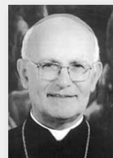
APUNTES PARA EL DÍA A DÍA (414)