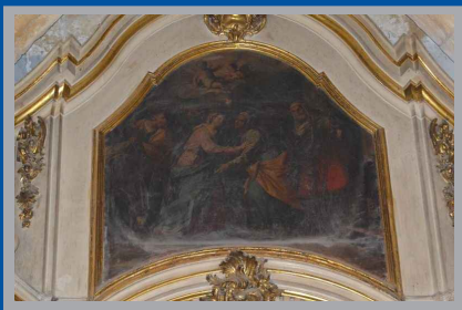
Lienzo de la Visitación. s. XVIII Retablo de la Capilla del Nazareno. Catedral de Murcia.